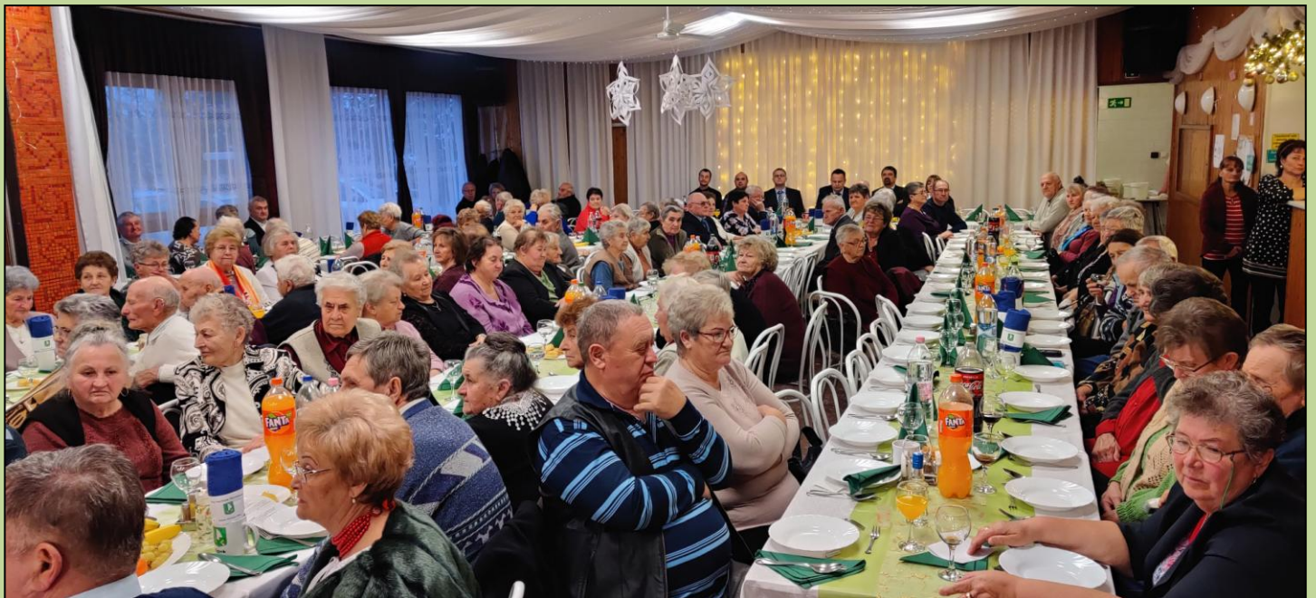
Idősek adventje szombati nap