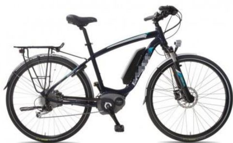
pedálos ráségítéssel rendelkező kerékpár /0,25 kW teljesítményű elektromos motorral/

A pedálráségítés azt jelenti, hogy egyes kerékpárokat olyan elektronikával szerelnek fel, ami érzékeli, ha az ember fárad. Amennyiben a kerékpáros nem teker eléggé, akkor a motor adja a hiányzó teljesítményt. Ez például egy kerékpárfajta, melynél csak akkor működik az elektromos ráségítés, amikor teker a vezető.