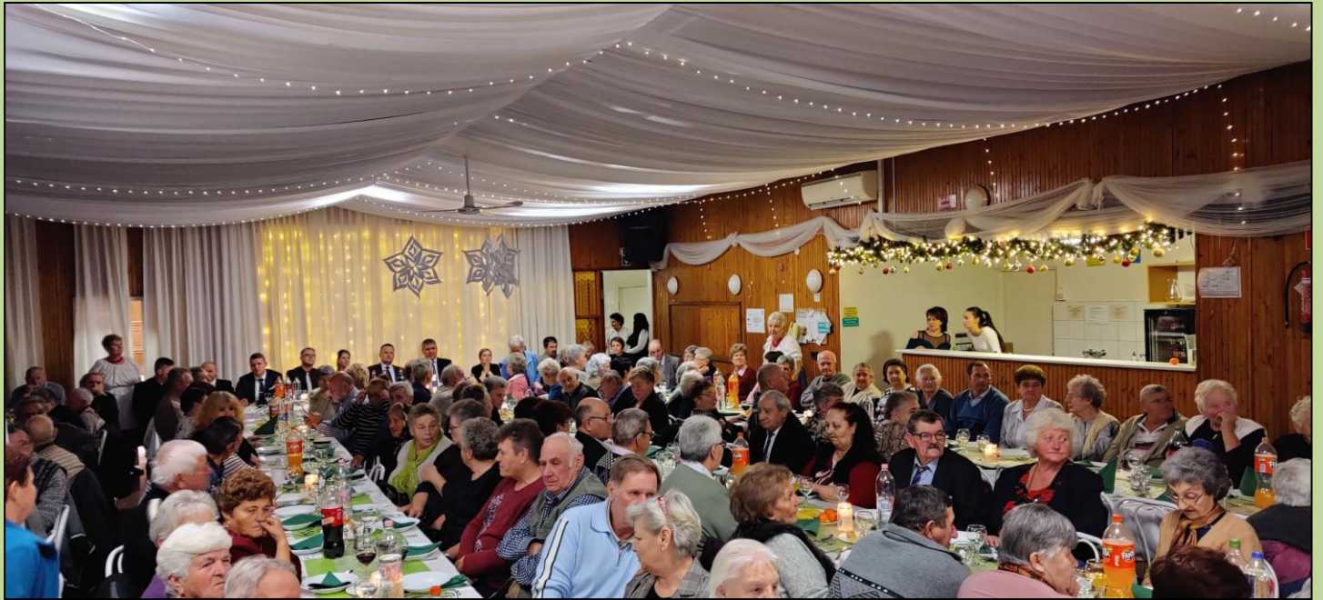
Idősek adventje pénteki nap